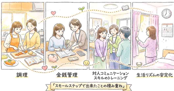
「スモールステップで出来たことの積み重ね」

調理・金銭管理・コミュニケーションなどのトレーニングを通して、生活リズムの安定を目指します。まずは安心して過ごせる場所として、スモールステップで外で過ごす時間を増やしなが、できたことを積み重ね、一緒に課題を整理していきます。