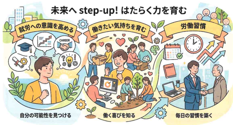
未来へ step-up! はたらく力を育む 自分の可能性を見つける 働く喜びを知る 毎日の習慣を築く