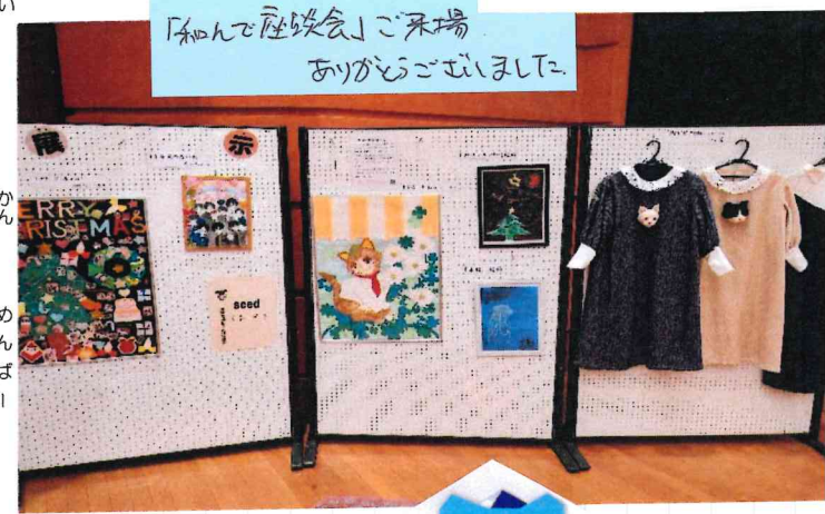
「和んで座談会」ご来場ありがとうございました。

また12月13日は区民ホールでの「和んで座談会」の作品展に出品しました。多くの地域の皆様に興味をもって鑑賞していただき次の機会も是非と創作意欲がさらに上がっています。他の事業所さんのワークショップや物販、音楽会にミニ四駆と目いっぱい地域交流を楽しみました。