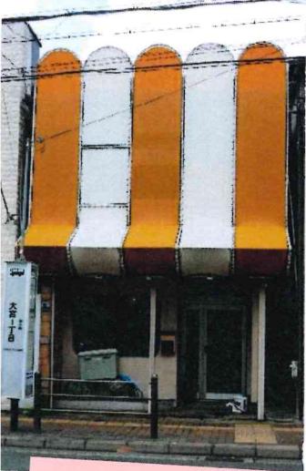
バス停「大宮1丁目」前がのびるーむ