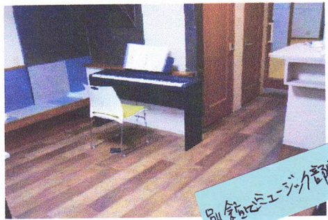
別館ミュージック部専用室