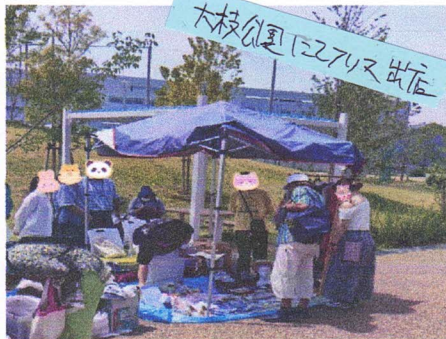
大枝公園に2アリス出店