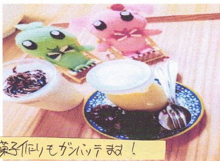
お菓子作りモカンパッてね!