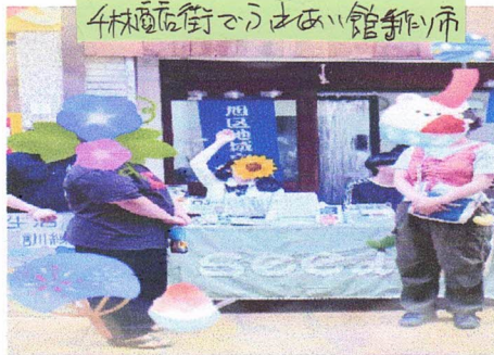
4林商店街でようばい館新開市