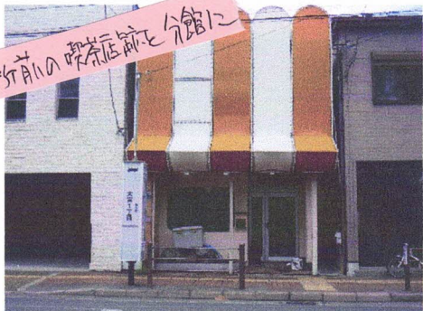
旭区役所前の喫茶店を分館に